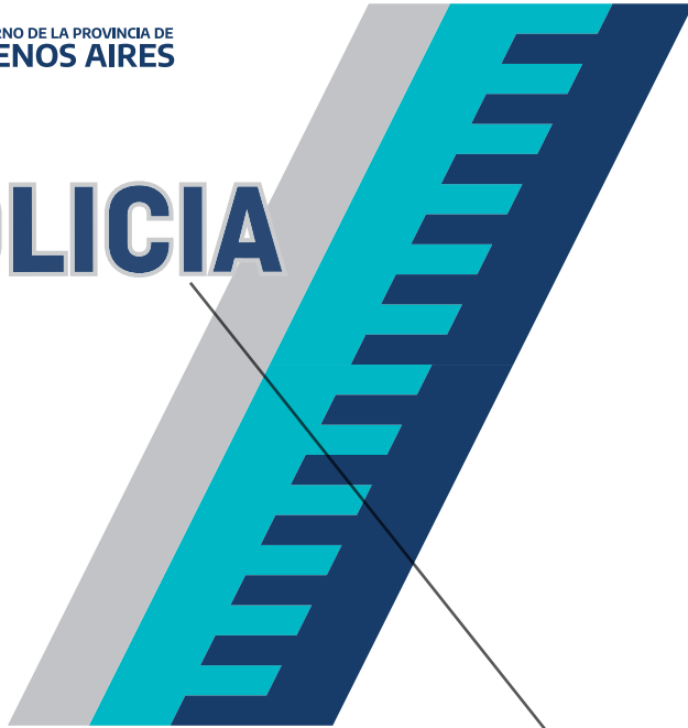
GRÁFICA GUARDABARRO FRENTE