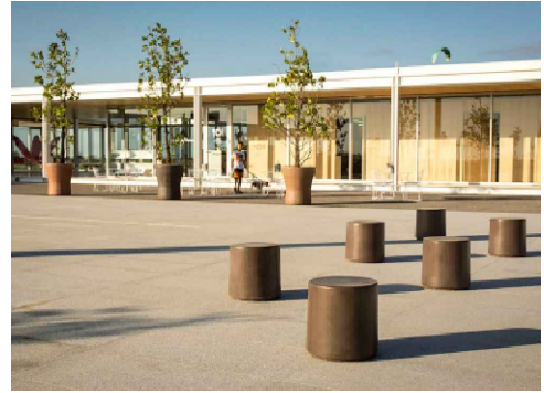
BANCO REHUE BAJO Y ALTO