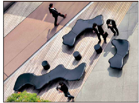
BANCO AMORFO 3 Y 4 PARTES