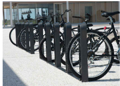
BICICLETERO COBRA CON SEPARADOR

PROVISIÓN DE EQUIPAMIENTO URBANO DE DISEÑO PARA ESPACIO PÚBLICO